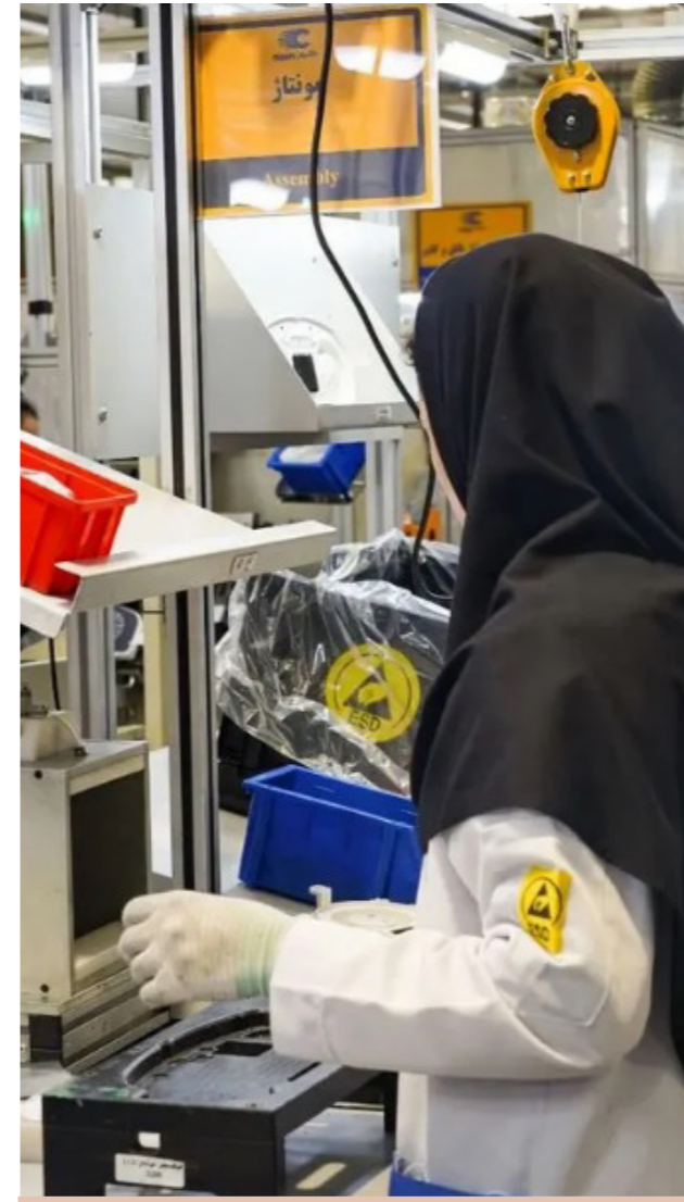
لا توجد إحصاءات دقيقة عن عدد العاملات في إيران

لا توجد إحصاءات دقيقة عن عدد العاملات في إيران، والبيانات المتوفرة، وهي غير مكتملة، تعتمد على عدد العاملات المشمولات بتغطية الجهات الحكومية. بينما تعمل العديد من النساء في وظائف غير رسمية أو أعمال منزلية، فإنهن الأكثر تضرراً. غالباً ما يُوظفن بموجب عقود غامضة أو عقود بيضاء موقعة مسبقاً، ويتقاضين أجوراً أقل من الحد الأدنى القانوني للأجور. (موقع تمكين الحكومة والمجتمع - 8 فبراير 2022)